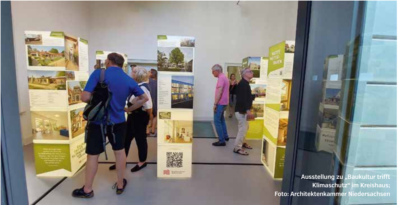
Ausstellung zu „Baukultur trifft Klimaschutz“ im Kreishaus